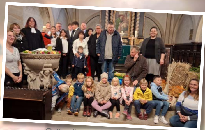
Gottesdienst Taufe Erntedank