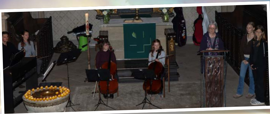
Andacht zum Pogrom am 9. November in St. Remigius Mengede