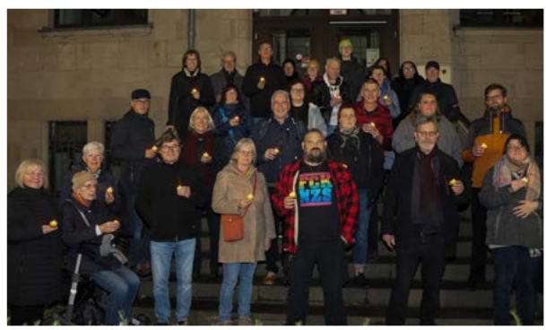
Gedenkveranstaltung zur Pogromnacht am 9. November