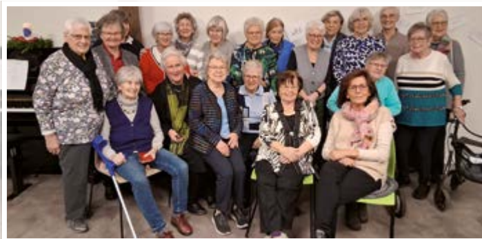
Die Frauenhilfe in Mengede traf sich am 11. Dezember zum letzten Mal; als Überraschungsgast kam der Nikolaus.