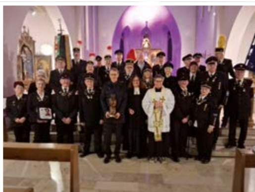
Barbaragottesdienst in Nette am 7. Dezember