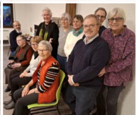
Projektchor in Mengede