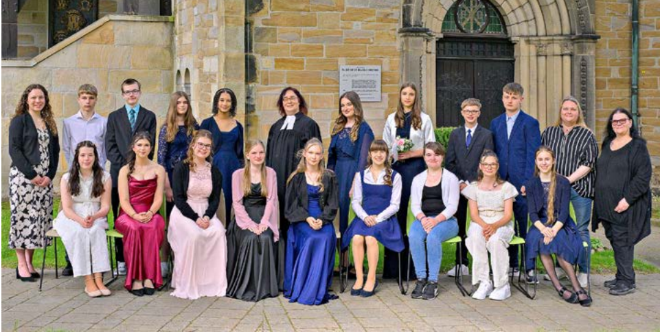
Mengede – 2. Mai 2026 – 16 Uhr