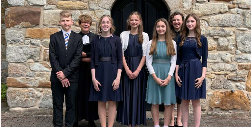
Bodelschwingh – 9. Mai 2026