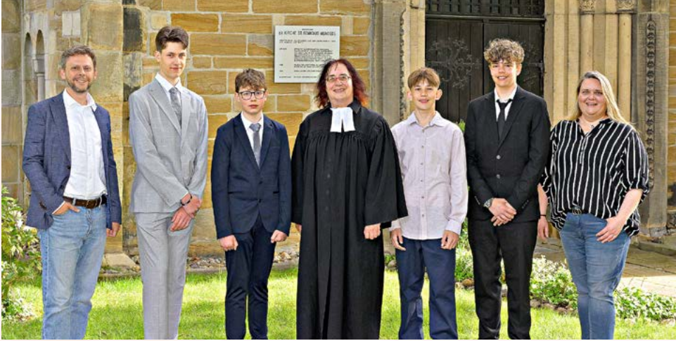
Mengede – 3. Mai 2026